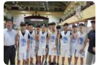
( 1 1 )